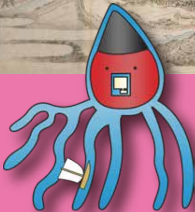
広島デルタの妖精「できるたこ（初代）」 川では舟運が盛んでした。